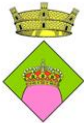
Ajuntament de Mont-ral